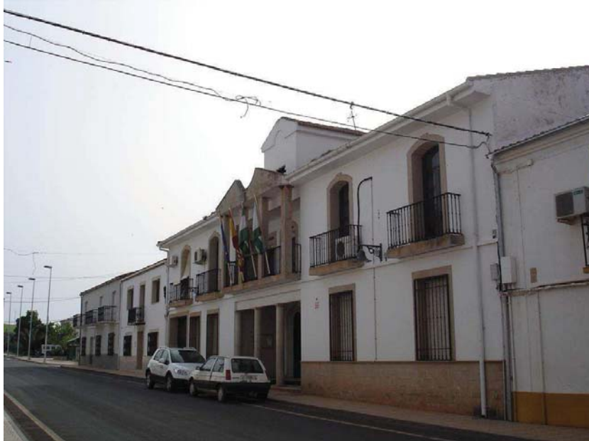
La casa del comandante civil de Montizón, después de ser cuartel de la Guardia Civil, fue demolida a partir de 1985 para construir un nuevo edificio para su ayuntamiento que fue finalizado en 1993. Foto: F. J. Pérez Fdez, 2010.