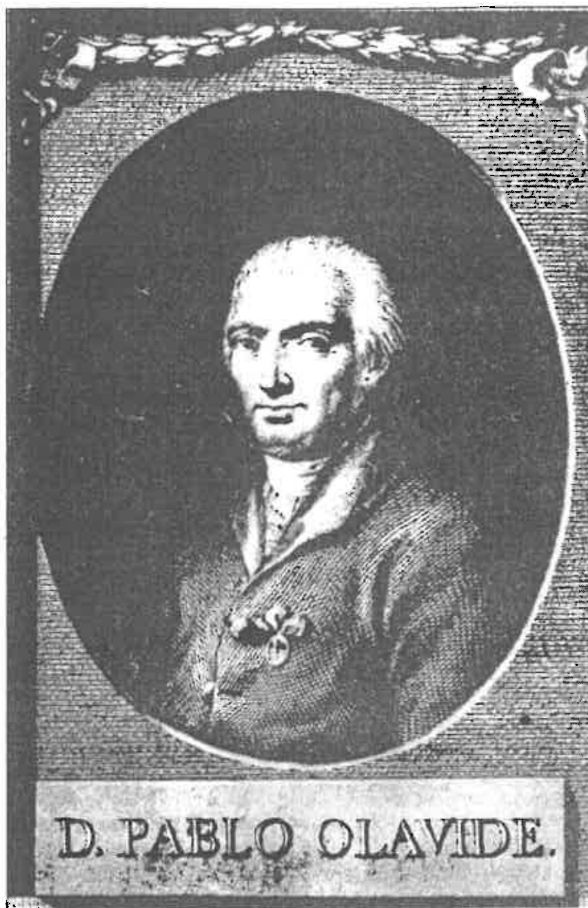
Pablo de Olavide hacia 1770, año en el que promulga la «Instrucción que han de observar los Alcaldes Pedáneos de las Nuevas Poblaciones de Sierra Morena».