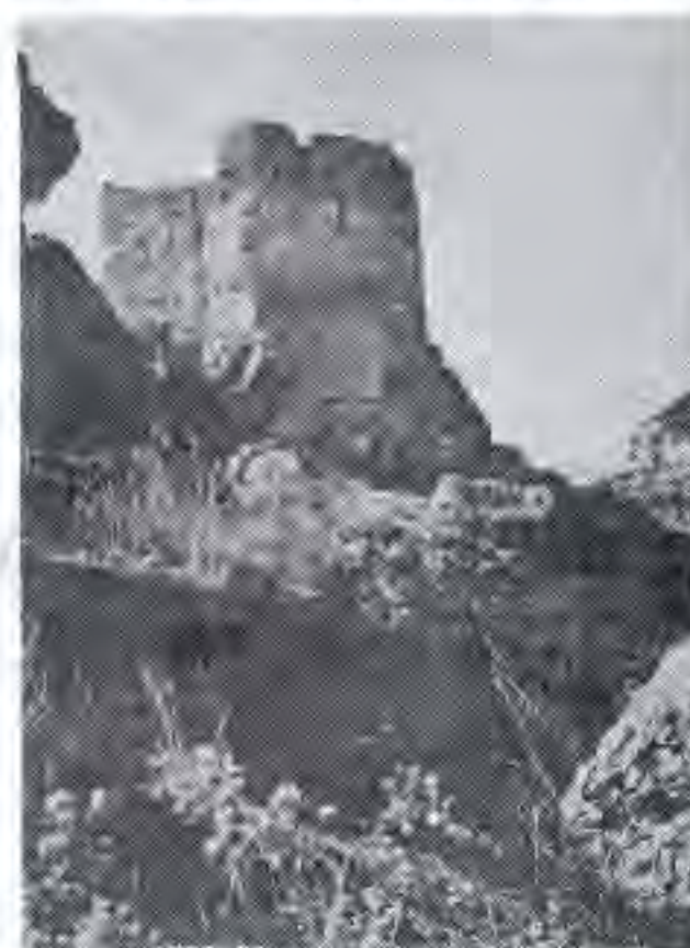
TORREJÓN DEL AGUILA. (Castello de Tolosa)

mina a la iglesia de San Juan de Letrán, toma con gran ceremonia el Lignum Crucis, y con aquella sagrada reliquia, venerando emblema de la redención del género humano, se traslada con su brillante séquito al palacio del cardenal Albani, y, presentándose en el balcón, dirige una fervorosa plática al inmenso y devoto pueblo cristiano que llena aquel vasto recinto.