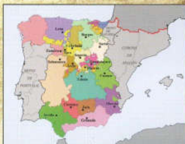
Ciudades con derecho a voto en Cortes en el siglo XVI

Sobre esta base administrativa creada por la monarquía de los Austrias, en