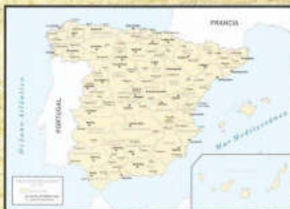
Prefecturas de José I

La invasión francesa de 1808 supuso un vendaval bélico que también afectó al territorio, una vez establecido en el trono el hermano mayor de Napoleón, José I ("Pepe botella"). Éste reorganiza el mapa español peninsular en 38 prefecturas (a la manera francesa) y 111 subprefecturas. Como dato curioso, la nomenclatura utilizada para cada una de ellas se aleja de los nombres clásicos e históricos, centrándose en accidentes geográficos tales como ríos y cabos (la actual provincia de Jaén llevaba el nombre de Prefectura del Alto Guadalquivir, con capital en Jaén y dos subprefecturas, en La Carolina y Úbeda).