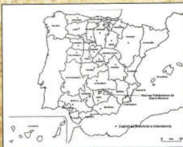
Mapa de la propuesta de Miguel Cayetano Soler

El mapa territorial de España irá conformándose definitivamente entre el siglo XIX y el XX, con una serie de proyectos, unos más ambiciosos y otros menos, donde convivirán dos formas de entender el estado: los últimos estertores del Antiguo Régimen, por un lado, y el naciente Estado Liberal, por otro.