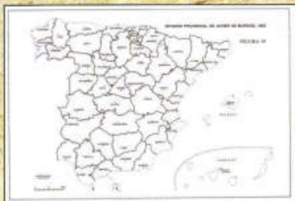
Mapa territorial de Javier de Burgos.

una sola, que tendría que esperar hasta 1927 para ser dividida en las dos actuales y totalizar España 50) eliminando enclaves y exclaves (no todos, como por ejemplo, el Condado de Treviño, de Burgos pero en Álava). Además, agrupaba las provincias en regiones, pero sin ninguna competencia administrativa.