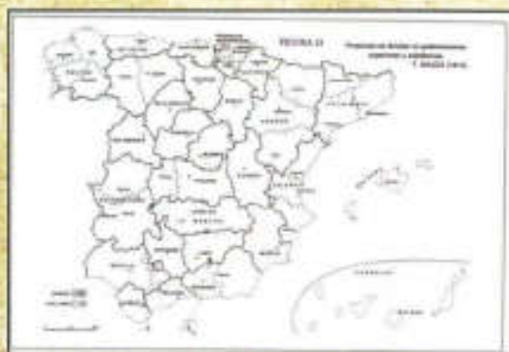
Mapa territorial de Felipe Bauzá

Habría que esperar a que las Cortes de Cádiz, en 1811, para ver un intento definitivo de suprimir las antiguas estructuras territoriales precedentes, asunto que se empezó a gestar a raíz de la eliminación de los señoríos jurisdiccionales. En 1812, la primera constitución española dejará sin efecto la personalidad política de los antiguos territorios históricos; se crean 32 provincias,