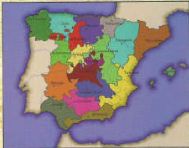
Intendencias de Felipe V

1720, el primer Borbón, Felipe V, ordenará la creación de las intendencias, que sumarían un total de 20 (La Coruña, León, Valladolid, Burgos, Pamplona, Zaragoza, Barcelona, Salamanca, Ávila, Guadalajara, Toledo, Madrid, Ciudad Real, Valencia, Mérida, Sevilla, Córdoba, Granada, Palma y Santa Cruz de Tenerife), pero que no coincidían demasiado con los viejos territorios de las ciudades con derecho a voto en cortes precedentes.