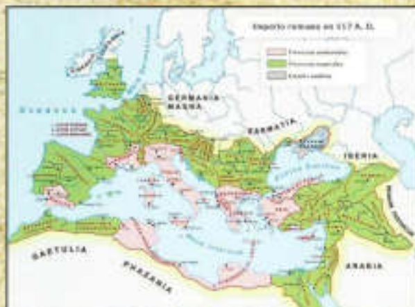
Provincias del Imperio Romano

términos: pro ("por") y vincia ("victoria"); esto es... "por victoria".