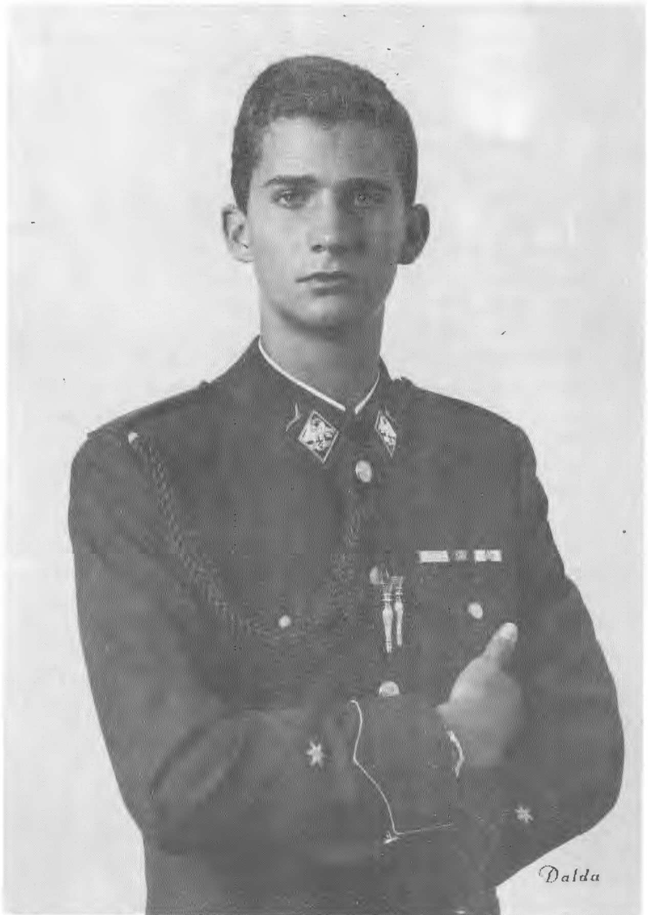
S.A.R. D. FELIPE DE BORBON Y GRECIA PRINCIPE DE ASTURIAS PRESIDENTE DE HONOR DEL CONGRESO