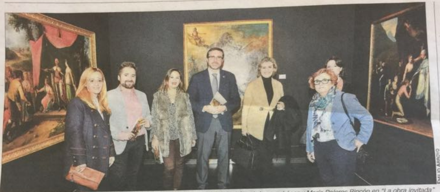
PREN Co co la de E. P — cor gén cel su pr na te ga pi er m n P I c I J