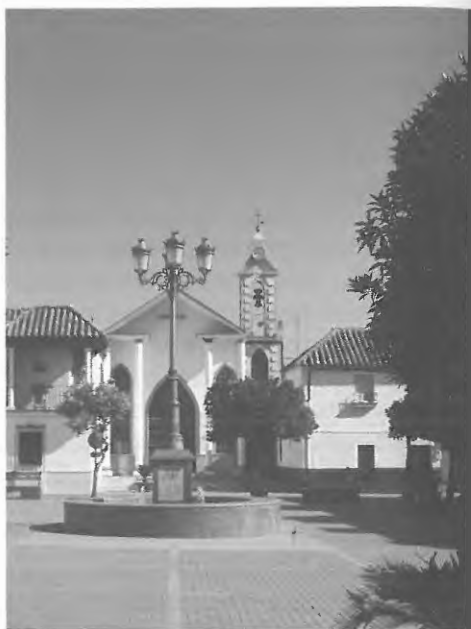
Iglesia construida en 1977