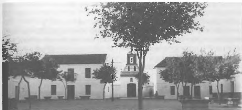
Iglesia de la época fundacional

y ornamentaron con muebles, imágenes, ornamentos y objetos procedentes de las Iglesias, colegios y conventos de los jesuitas expulsados de las ciudades de Sevilla, Córdoba, Carmona, Marchena o Écija, cuyos bienes incautados conformaron y siguen conformando la mayor parte del patrimonio artístico de los pueblos que integran las Nuevas Poblaciones.