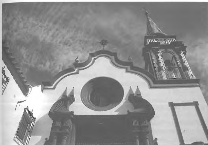
Fachada Iglesia actual