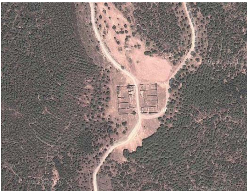
Vista aérea de la aldea de Magaña (Santa Elena).

Así que en junio de 1768, recién comenzadas las obras en este punto de población, la situación sería realmente precaria. La colonia no tenía iglesia ni pila bautismal, tal como nos especifica Didier en sus certificaciones. Seguramente los oficios religiosos se realizaban en la habitación de alguna de las casas con una capilla portátil, de igual manera que se estaba realizando en otras poblaciones de forma provisional. Didier nos comunicó en las partidas de bautismo como las ceremonias solemnes del bautismo eran suspendidas o reservadas para cuando se erigiera la pila bautismal en la colonia. Algo que nunca se llegó a realizar.