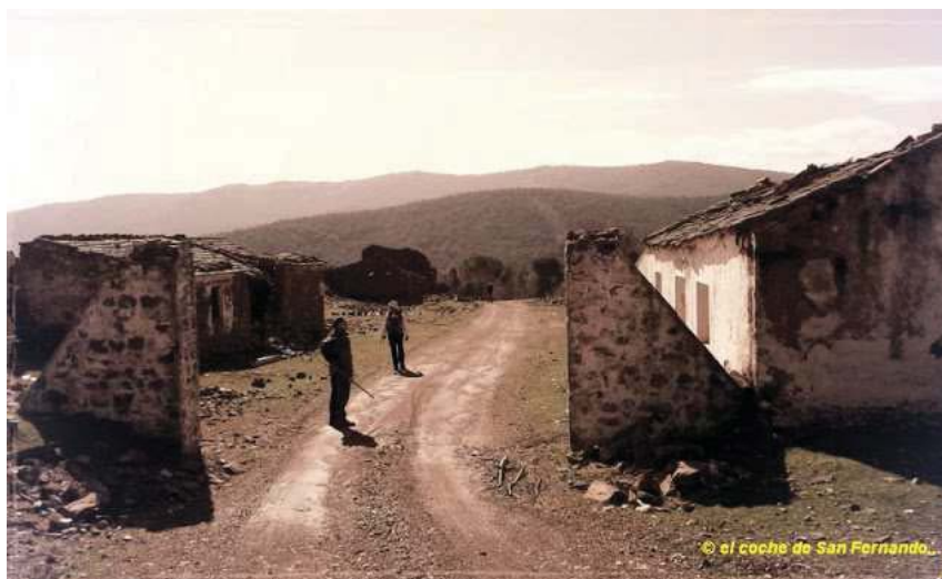
Entrada a la aldea de Magaña (Santa Elena).

Como podemos ver, la escasa población del lugar y su alejamiento de la iglesia de Miranda o la de Santa Elena, facilitó que los colonos de esta colonia fueran atendidos por el párroco del Viso del Marques. Incluso desplazándose los colonos de Magaña al Viso para recibir la debida atención espiritual. No en vano, y como dijimos anteriormente Magaña estaba dentro de la Archidiócesis de Toledo.