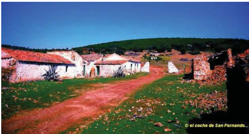
La aldea de Magaña (Santa Elena). En la actualidad es una cortijada abandonada.