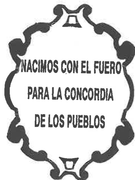
MAQUETA DEL ESCUDO Y MEDALLA DE LAS NUEVAS POBLACIONES DE SIERRA MORENA Y ANDALUCIA