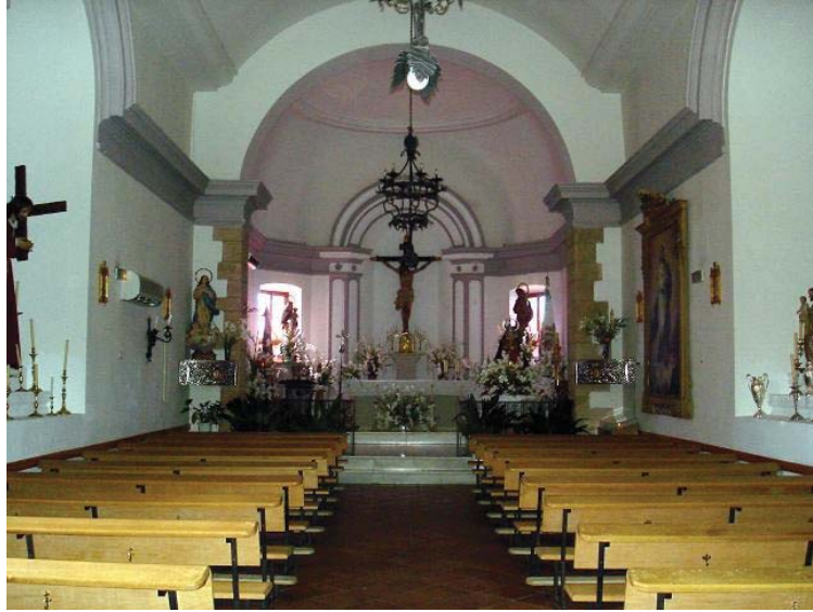
Interior de la Iglesia de la Inmaculada Concepción de Navas de Tolosa.