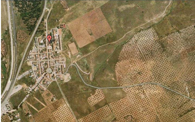
Vista aérea del casco urbano de Navas de Tolosa y de parte de las suertes que componían su feligresía. Google, 2011.

DOCUMENTO 8. Archivo Histórico Municipal de Aldeaquemada. Gobierno de la provincia de Jaén. Distribución de dicha Provincia en Gobiernos particulares y Distritos, con expresión de los pueblos a que cada uno corresponde. 1810.