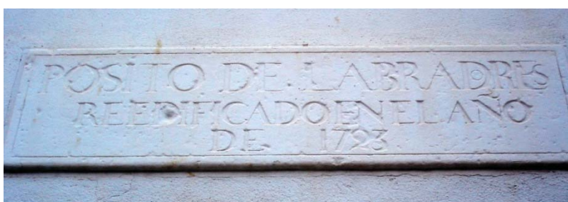
Placa que conmemora la reedificación del pósito de Labradores de Navas de Tolosa durante la Intendencia de Miguel de Ondeano (siglo XVIII). El pósito estaba situado en la plaza de la Cruz.