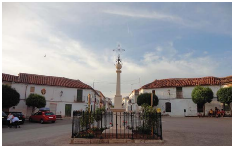
Monumento a la Santa Cruz marcando el eje de la calle Real desde la plaza de la Iglesia dirección a Madrid. Las casas de los colonos (siglo XVIII) forman con sus fachadas una plaza poligonal que se abren al Camino Real de Andalucía y al Camino de Granada. Foto del autor, 2012.