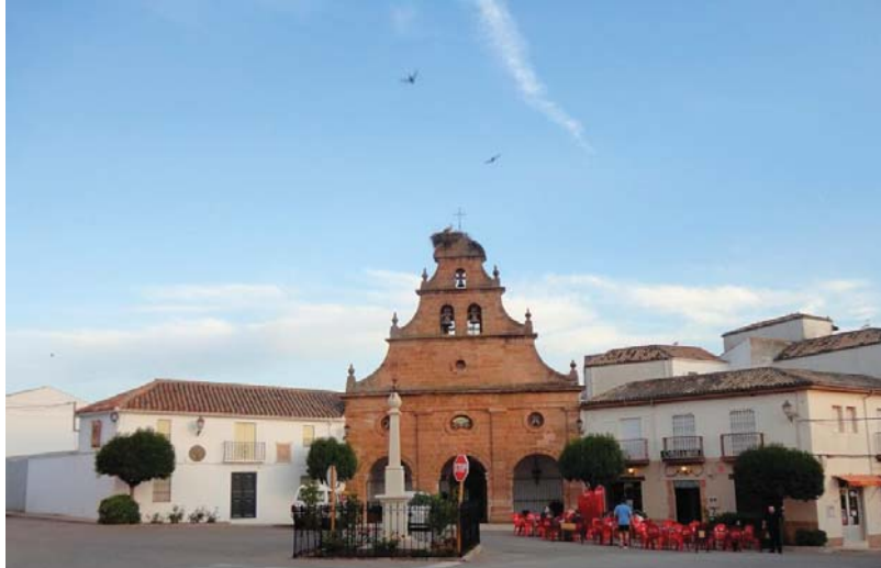
Casa del párroco, iglesia de la Inmaculada Concepción y casa del comandante civil de Navas de Tolosa, siglo XVIII. En primer término el monumento a la Santa Cruz. Foto del autor, 2012.