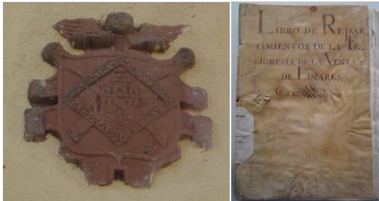
Escudo de la venta de Linares situado en una de las casas que se construyeron sobre el solar de la antigua posada en la calle San Antonio de Navas de Tolosa (siglo XVII).