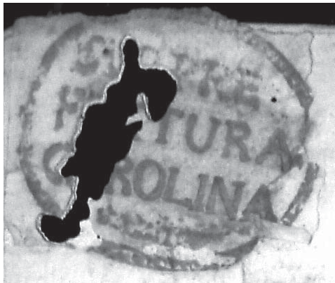
1811. Sello de la Subprefectura de La Carolina.