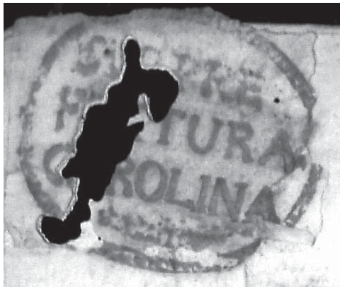
1811. Sello de la Subprefectura de La Carolina.