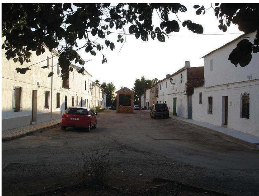
Calle principal de la aldea de El Acebuchar con el altar de obra realizado para colocar a San Isidro Labrador. Foto: F. J. Pérez Fernández, 2010.

Abandonando la A4, antiguo Camino Real de Andalucía, a la altura de la colonia de Carboneros 1 , tomamos la carretera JA-6102, que nos conduce directamente a la aldea de El Acebuchar.