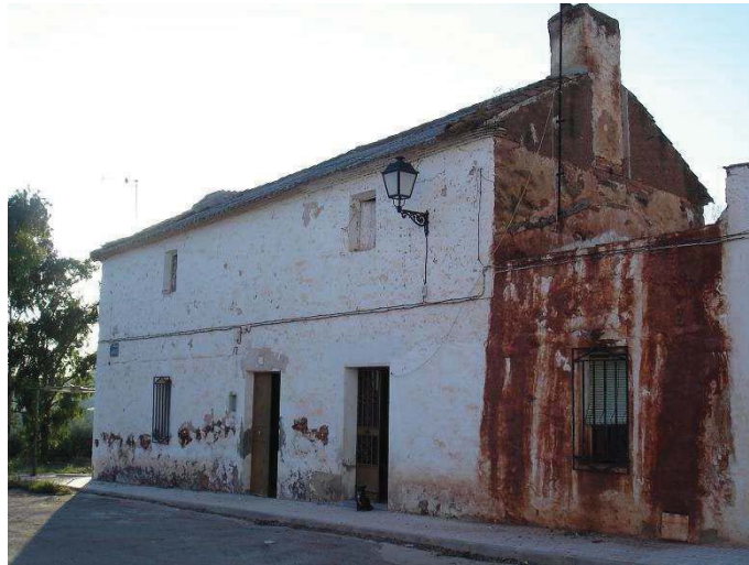
Casa de colonos de la aldea de El Acebuchar con puerta delantera para entrar al corral convertida en una ventana.