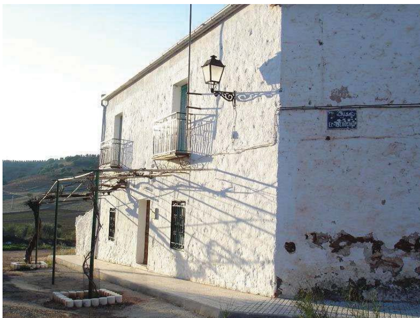
Casa de colonos de la aldea de El Acebuchar formando chaflán. Foto: F. J. Pérez Fernández, 2010.

Las casas coloniales que todavía se conservan en la aldea son las típicas de la colonización carolina de Sierra Morena y particularmente de los modelos utilizados en otros núcleos rurales. Se conservan practicante todas las casas de colonos, y algunas de ellas con pocas reformas. Son sencillas, de dos plantas, con la puerta flanqueada por dos ventanas simétricas. En la planta superior también encontramos dos vanos, que junto con la poca altura de este piso ayudaba a emplearlo como cámara que se utilizaba para almacenar cereal y aperos (Sánchez 1996: 257).