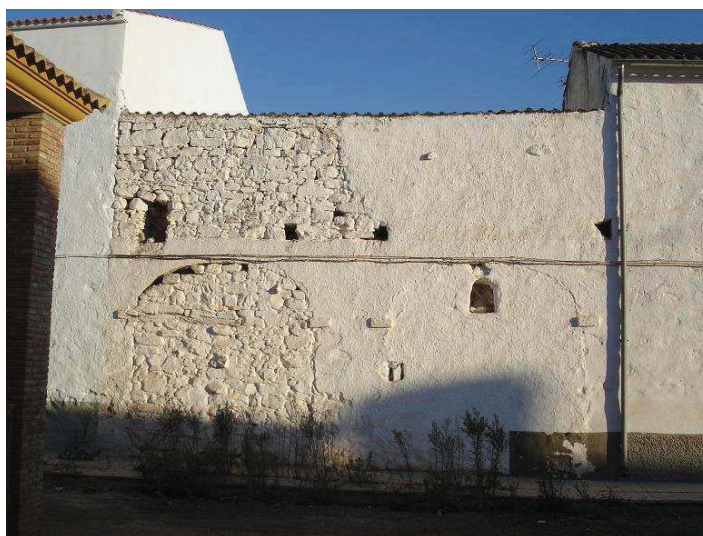
Detalle de los arcos cegados que eran las puertas delanteras para entrar al corral.

Las casas de la aldea poseen una entrada frontal para los animales que daba acceso al corral sin necesidad de atravesar la vivienda, que estaba conformado por un gran portón adintelado mediante un arco elíptico que arrancaba en un pequeño filete a modo de collarín sobre las jambas. La puerta, de dos hojas, estaba abisagrada mediante el empotramiento de la prolongación de los goznes en el suelo y en un segundo dintel recto por el interior del arco (Sánchez 1996: 262). Algunas casas presentan cegadas estas puertas de corral, dejándose entrever el arco. Los materiales constructivos solían ser en el mejor de los casos piedra de distintos tamaños y ladrillos, que se encalaban una vez concluida la fachada. La techumbre se realizaba con una estructura de madera a tres aguas 2 que posteriormente se cubría con tablas encima de las cuales se situaba teja árabe de barro.