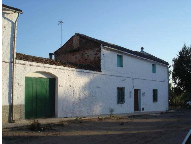
Casa de colonos de la aldea de El Acebuchar con puerta delantera para entrar al corral.