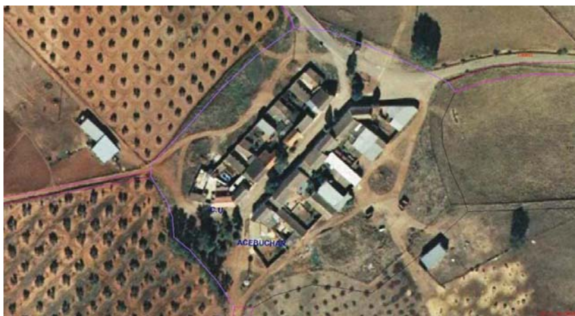
Vista aérea. Aldea el Acebuchar. Oficina virtual del Catastro. 2009. (Sánchez-Batalla 2011: 78).

La feligresía de Carboneros, realizada dentro de los planes de ampliación de las colonias llevados a cabo durante el año 1768 quedó constituida finalmente por Carboneros, su capital, y cuatro aldeas: La Escolástica, Los Cuellos, La Mesa y El Acebuchar. De entre todos estos núcleos, queremos acercarnos por medio de este artículo a la aldea de El Acebuchar, una pequeña joya urbanística dentro de las Nuevas Poblaciones.