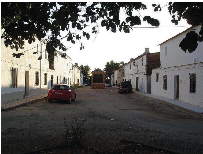
Calle principal de la aldea de El Acebuchar con el altar de obra realizado para colocar a San Isidro Labrador.

Abandonando la A4, antiguo Camino Real de Andalucía, a la altura de la colonia de Carboneros 1 , tomamos la carretera JA-6102, que nos conduce directamente a la aldea de El Acebuchar.