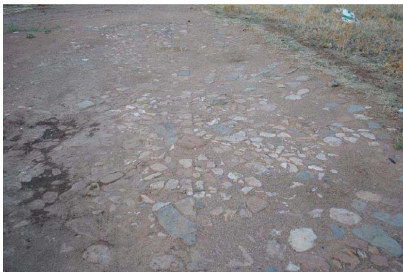
Era en el ejido de la aldea de El Acebuchar. Autor: Félix Sánchez Fernández, 2010.

Conforme nos alejamos del casco urbano podemos encontrar en el ejido algunas eras, testigos del pasado agrícola de la población que servían para trillar los cereales. El paisaje de dehesa, tan común en las Nuevas Poblaciones de Sierra Morena, y el olivar, todavía muestran la estructura de las suertes de los colonos, que enmarcadas por multitud de caminos, los que aquí se conocen como “líneas”, nos llevan a otras aldeas coloniales cercanas como La Mesa de Carboneros, Martín Malo en Guarromán o La Fernandina en La Carolina.