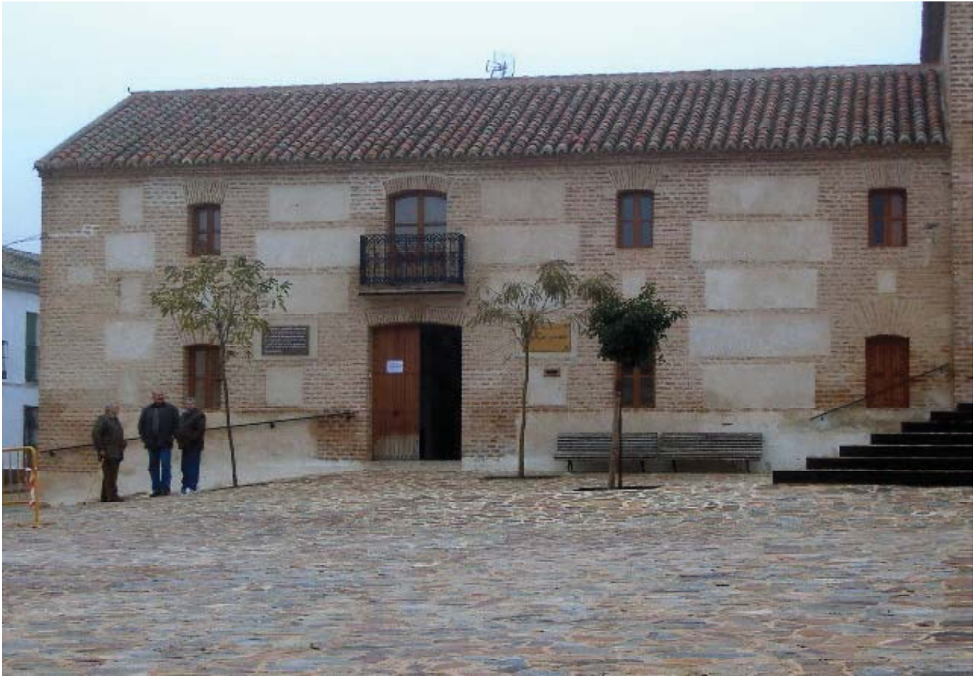
Casa del comandante de Aldeaquemada. Posteriormente pasó a ser Casa Consistorial y en la actualidad es el Hogar del Jubilado

ayuntamientos interinos en cada una de ellas. El 28 de marzo, en La Carolina se nombró para Aldeaquemada el ayuntamiento que puede verse en la página anterior.