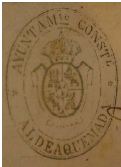
Sello del Ayuntamiento Constitucional de Aldeaquemada. Siglo XIX

intendentes) y los alcaldes mayores, que fueron visibles desde el nacimiento del nuevo cargo 4 . Con este artículo, parece ser que quedaba la puerta abierta desde el nacimiento de las colonias a una normalización que las trasladara con el tiempo, una vez que sus pobladores fueran capaces de valerse por sí mismos, a una incorporación al régimen general del resto de los pueblos de la Corona española, que era más adecuada a la homogeneización impulsada desde la dinastía borbónica.