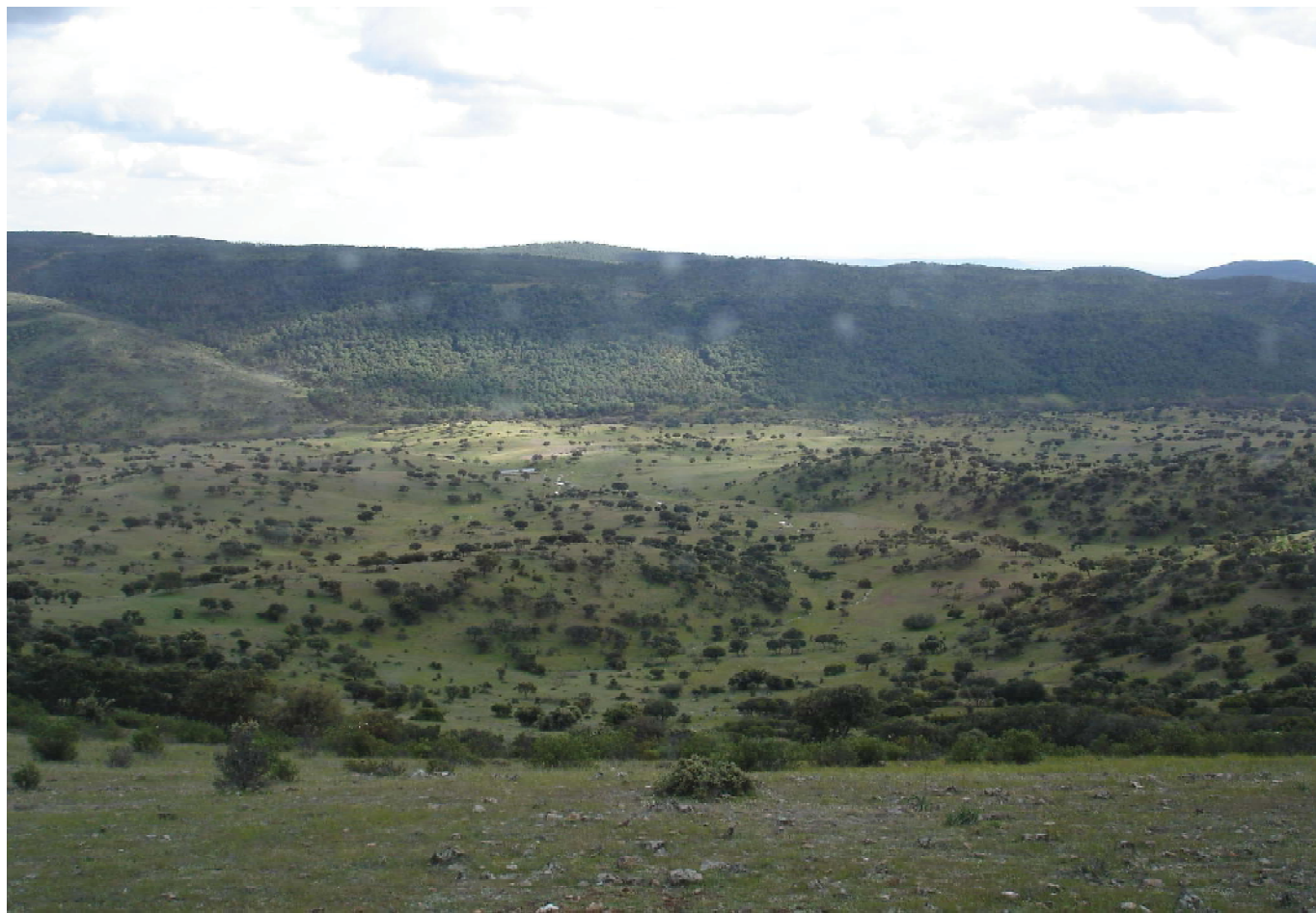
Vista de la Dehesa Navalacedra, propiedad del Ayuntamiento de Aldequemada. En la actualidad dedicada sobre todo a la explotación cinegética