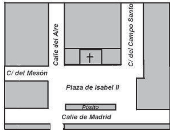
Detalle del centro de Aldeaquemada con el nombre de las calles de 1835. Elaboración propia

Libro de Actas Capitulares para dicha Población