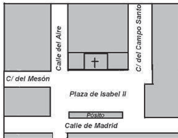
Detalle del centro de Aldeaquemada con el nombre de las calles de 1835. Elaboración propia

Libro de Actas Capitulares para dicha Población