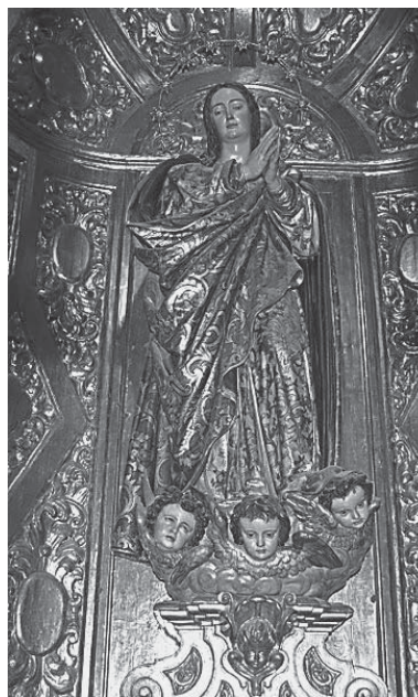
Inmaculada de M. Montañés

La imagen deriva de la bellísima “Cieguecita” de la catedral de Sevilla, en la que Martínez Montañés estableció el paradigma inmaculista de los escultores sevillanos del Barroco. De aquella, conserva el desplazamiento de las manos hacía la izquierda para favorecer la visión del rostro, el escabel nuboso recamado de querubines y la disposición de las piernas: la izquierda exonerada y la derecha soportando el peso del cuerpo. No obstante, la Virgen ha perdido aquí el empaque solemne de la imagen montañesina y aquellas telas aplomadas flotan ahora animadas por la brisa berninesca que introdujo Arfe en los talleres de Sevilla, con la misma libertad que pudo permitirse Murillo, libre de ataduras que al escultor le impone la materia.