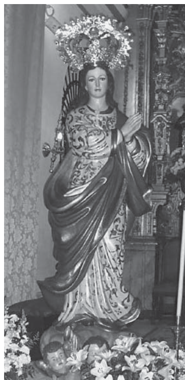
Patrona de Fuente Palmera