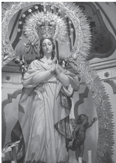
Patrona de La Carolina

verdoso, impropio de la iconografía inmaculista, también posee otra inmaculada de tamaño reducido pero preciosa que se procesiona en lugar de la patrona. Igualmente la patrona de La Luisiana es una bella imagen que parece proceder de la escuela granadina, pues la cabeza la inclina a la derecha; y la desaparecida Inmaculada de Fuente Palmera, también podría proceder de un taller de la escuela sevillana, con las manos apenas unidas a la altura del pecho. Todas las imágenes emergen de un nimbo con querubines, pero la de La Luisiana tiene un globo terráqueo y la de Fuente Palmera una luna con los picos hacia arriba. La actual patrona de Fuente Palmera, fue esculpida por Antonio Castillo Lastrucci, en 1938, es una preciosa imagen, mayor que el natural, inspirada en la anterior patrona. La Purísima de La Fuencubierta, es del último tercio del siglo XVIII y de claro aspecto rococó.