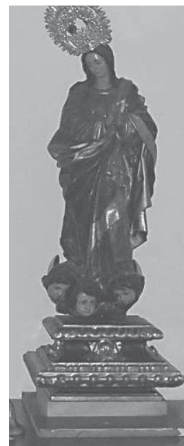
Purísima de San Sebastián 2