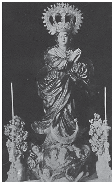
Antigua Virgen de Fuente Palmera

De la comparación entre esta imagen y la desaparecida, se desprende que Castillo Lastrucci pretendió imitar a la antigua. De ella conserva un cierto ahusamiento compositivo, que seguramente pesó en la filiación granadina. No obstante, la posición de las manos- más altas de lo que es habitual en las inmaculadas barrocas de la escuela de Granada- y el acusado “contraposto” entre éstas y la dirección de la mirada- aspectos con precedente asimismo en la imagen antigua- refuerzan nuestra creencia de que dicha obra fue fruto de los talleres sevillanos de la segunda mitad del siglo XVIII.