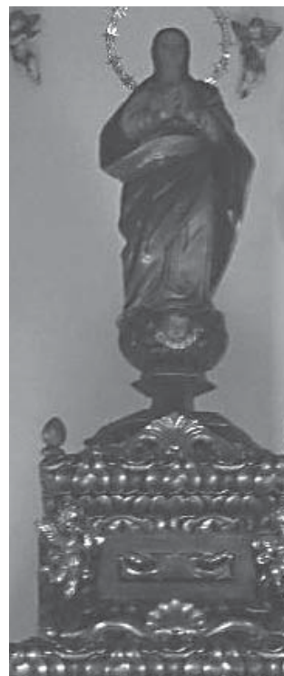
Purísima de San Sebastián

Según queda dicho, advertimos en esta obra algunos detalles propios de las inmaculadas granadinas de estirpe canesca. No obstante, y aunque los paños tienden a ceñirse en la base de la figura, adolece del marcado ahusamiento compositivo que distingue a las imágenes conceptistas salidas de los talleres de Granada. A dicha topología responde, sin duda, la pequeña talla de las Pinedas, que fue restaurada por Díaz Peno, tras la Guerra Civil, pero éste no es el caso de la pieza que nos ocupa.