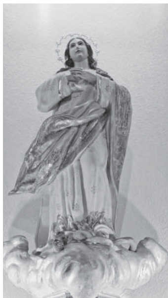
Patrona de Montizón