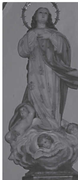
Patrona de Santa Elena