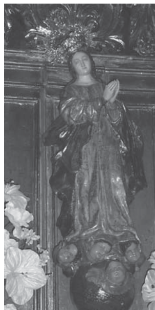
Patrona de La Luisiana