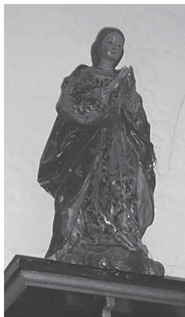
Purísima de Fuencubierta

FUENCUBIERTA. Es una imagen de claro aspecto rococó, posiblemente de un taller madrileño, tal vez del último cuarto del siglo XVIII.