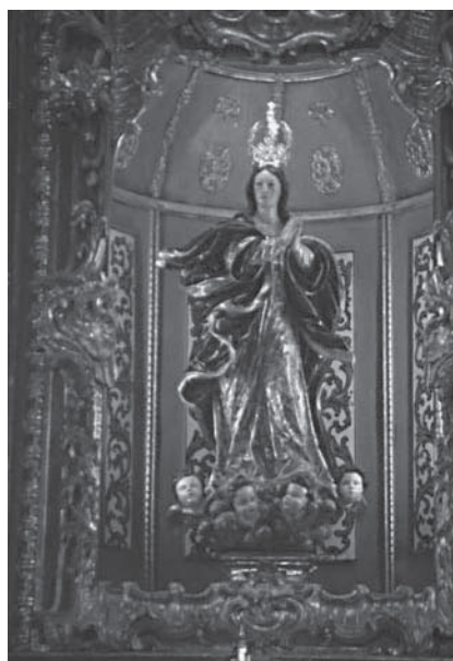
Patrona de La Carlota

Se trata de una bella pieza de tamaño menor que el natural, que efigia a María sobre un nimbo celeste del que emergen cuatro cabezas de querubines. La Virgen viste túnica beige estofada y enriquecida con decoración floral y manto azul orlado en oro y con vueltas jacinto. Los paños, como insuflados por el viento, vuelan con gran libertad lo que, unido a la diagonal formada por