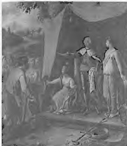
Fragmento del cuadro 'Carlos III funda las colonias de Sierra Morena y Andalucía', pintado en 1805 por Victoriano López y conservado en el Alcázar de Segovia.

tos de la llegada de colonos protestantes. Es más, fue precisamente en estas colonias donde el fenómeno alcanzaría su máxima expresión; moviendo a la alarma incluso a una Inquisición caracterizada entonces por su escasa actividad. Del mismo modo que ocurriera en Sierra Morena, también aquí las primeras referencias que poseemos sobre estos colonos nos vienen dadas por el arribo al puerto de Almería, concretamente el diecinueve de noviembre de 1768, de un grupo de 152 colonos entre los que se encontraban seis protestantes y dos mujeres calvinistas, que como aquellos abjuraron 7 .